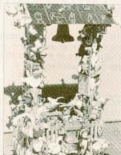
Blickfang mit Klang: Das zentrale Schmuckstück im Wohnzimmer-Atelier.